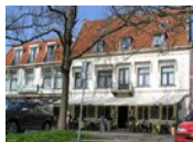
Hotel Restaurant Die Port van Cleve *** (Enkhuizen) www.deportvancleve.nl