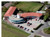
Fletcher Duinhotel Burgh Haamstede **** (Burgh Haamstede)

A la hora de seleccionar los hoteles, intentamos tener en cuenta en la medida de lo posible un cobertizo para bicicletas seguro y cerrado. Sin embargo, no podemos garantizar esto en todos los hoteles y esto depende en parte del número de bicicletas de otros huéspedes del hotel.